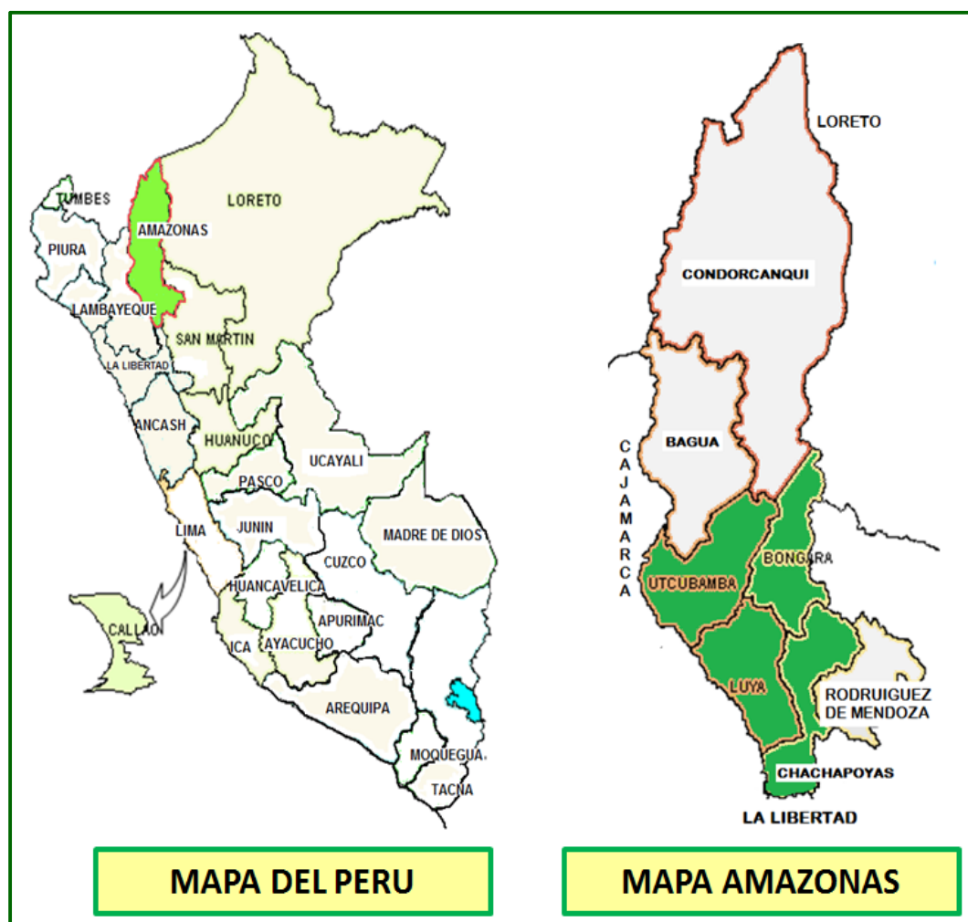
Figura 1: UBICACIÓN POLITICA DE LA REGION AMAZONAS