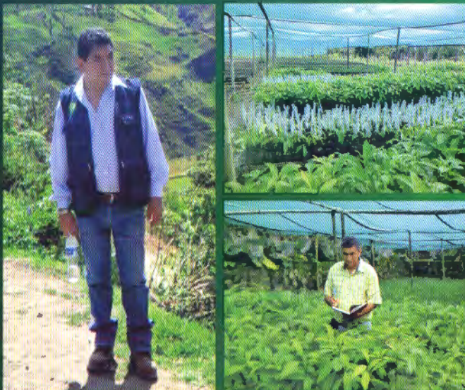
Director Ejecutivo, visitando la zona de intervención del proyecto

Este proyecto tendrá una duración de tres años, desde el año 2013 al 2015