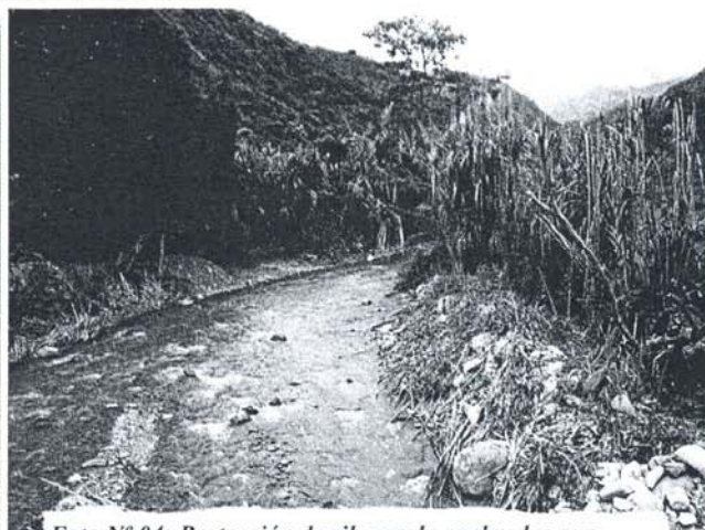
Foto N° 04: Protección de riberas de quebradas que atraviezan la carretera con caña brava y carrizo.